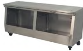
Mesa / Table Ref. 773.535 (Lux) Ref. 773.536 (Silver)