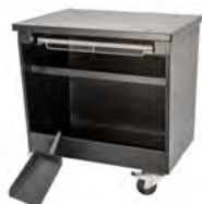
Mesa / Table Ref. 770.248 (Lux) Ref. 770.348 (Silver)