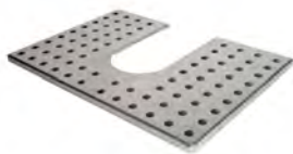
Atemperador / Warming Tray Ref. 924.048