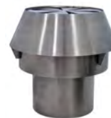
Chimenea / Chimney Ref. 759.013

* Este horno tiene la posibilidad de ser utilizado con múltiples tipos de parrillas (varilla, acanalada, pinchos, planchas, etc.). El límite lo pone la habilidad e imaginación del chef.