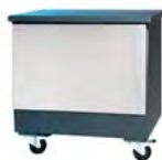
Mesa / Table Ref. 773.500 (Lux) Ref. 773.501 (Silver)