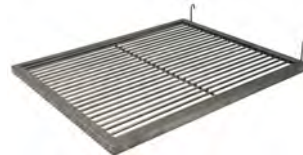
Parrilla varilla / Rod grill Ref. 900.022