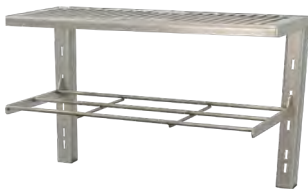
Columna calentaplatos & parrilla calentaplatos / Warming column & warming grill Ref. 920.150 & 920.322