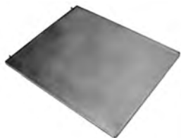
Plancha / Griddle Ref. 901.024