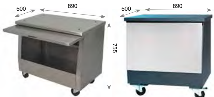
MESA ESP-80 SILVER