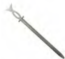
PINCHO SIMPLE ESP