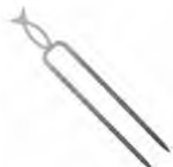
PINCHO DOBLE ESP