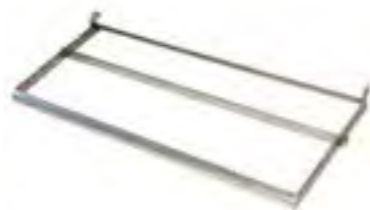
Soporte pinchos 80 (x1) / 160 (x2) Ref.: 923.500 Precio: 155 €