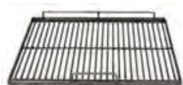
Parrilla de varillas