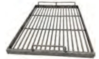
Parr. varillas lateral