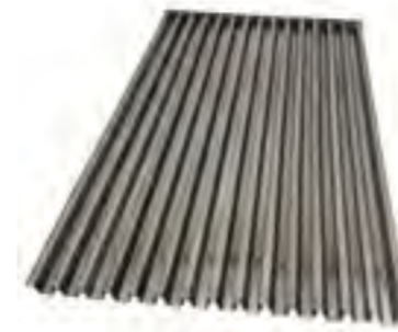
Parr. acanalada lat.