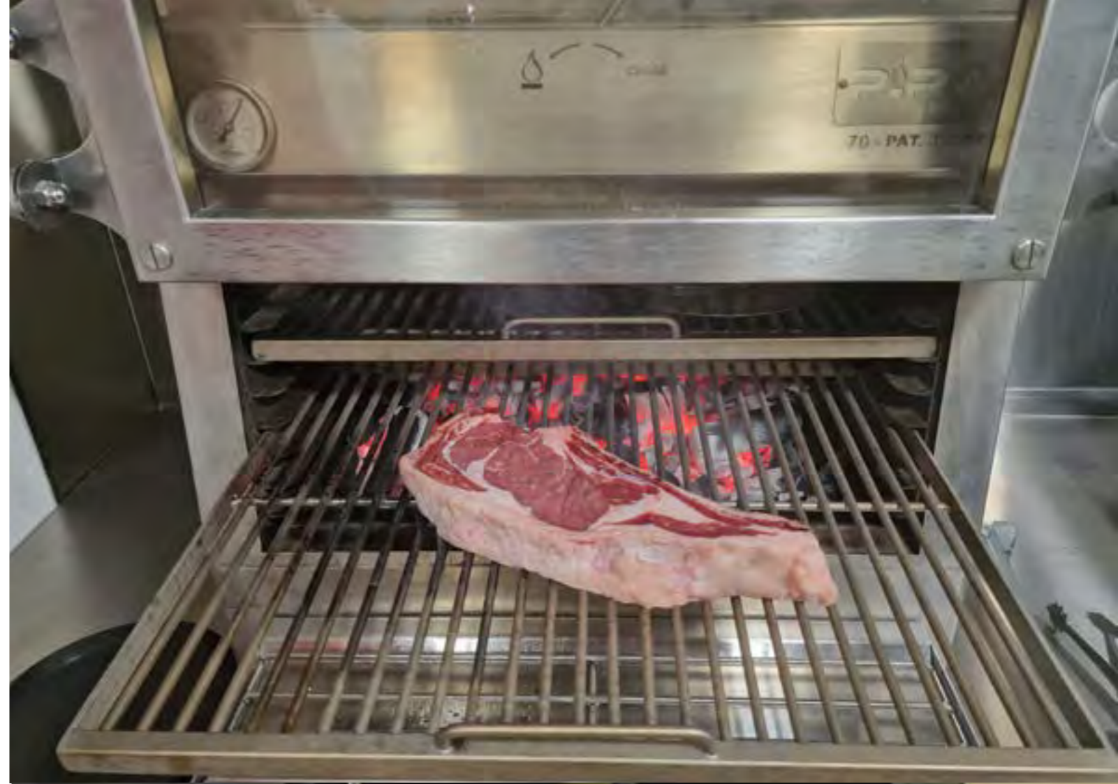
Paco Roncero. Pinzas TOP.