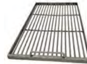
Parr. varillas central (solo Combi Lux 150) Ref.: 900.141