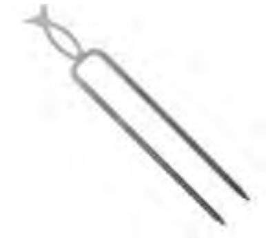
Pincho doble (solo complet) 80 (x4) / 160 (x8) Ref.: 923.511