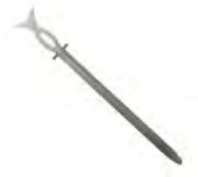
Pincho simple (solo complet) 80 (x4) / 160 (x8) Ref.: 923.501