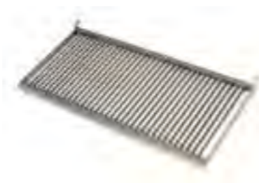
Parrilla varillas (solo complet) Ref.: 923.515