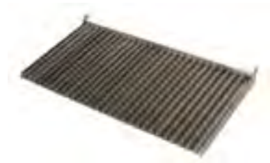
Parrilla acanalada (solo complet)