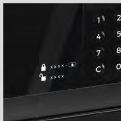
Indicaciones de uso en teclado