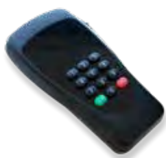
Auditoría en ordenador con mando CEU