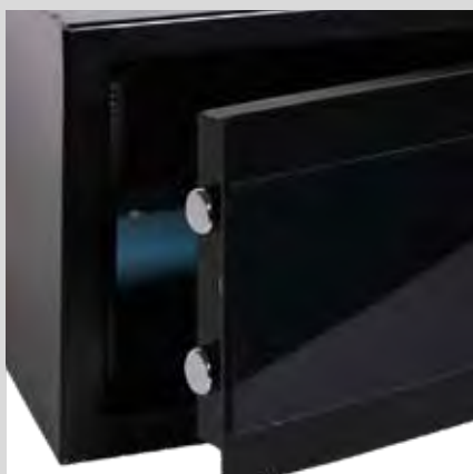
Bulones Ø18 mm

Diseño y seguridad se unen en la serie Java para satisfacer las necesidades de los huéspedes más exigentes.