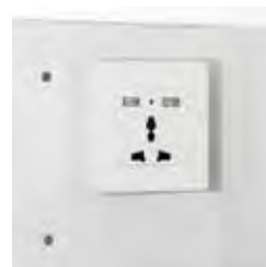
Enchufe interior con USB

Diseño y seguridad se unen en la serie Java para satisfacer las necesidades de los huéspedes más exigentes.