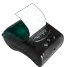
Impresora auditoría en papel