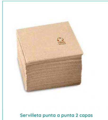
Servilleta punta a punta 2 capas