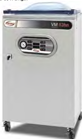
B-53 H Brighth