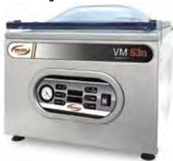
B-53 GAS Brighth