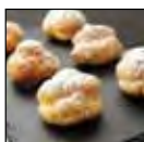
Lavado de gas pastelería suave