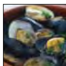
Lavado de mejillones y almejas.