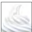
Lavado de gas pastelería fuerte