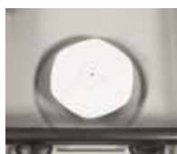
Base para contenedores