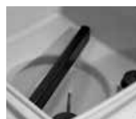
Barra de sellado desmontable sin herramientas