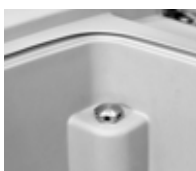
Válvula de aspiración