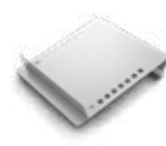
Estantes Planos Inclinados