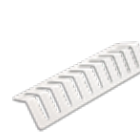
Easy, para la creación del vacío externo