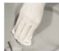
Limpieza de cámara siempre perfecta