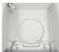
Cámara de vacío ultra resistente