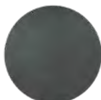
PLACA TEF. LISA