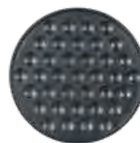
PLACA TEF. 37