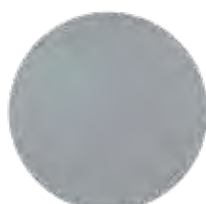
PLACA INOX. LISA