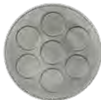
PLACA INOX. 7