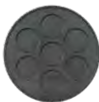
PLACA TEF. 7