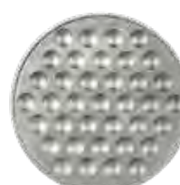
PLACA INOX. 37