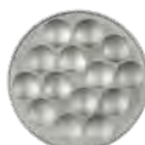
PLACA INOX. 14