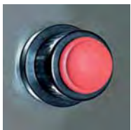
Chispero / Lighter