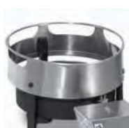
Wok (solo HQ04) / Wok (only for HQ04)