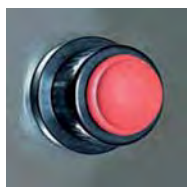
Chispero / Lighter