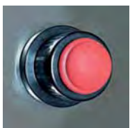
Chispero / Lighter