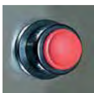
Chispero / Lighter