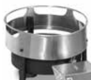
Wok (solo HQ04) / Wok (only for HQ04)