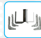
Raschiatori amovibili Removable scrapers