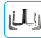
Raschiatori amovibili Removable scrapers