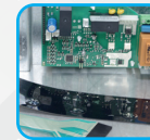
Controllo di densità Density control