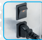
Cavo alimentazione removibile Removable power cord