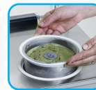
Cestello estraibile Stainless steel removable bowl