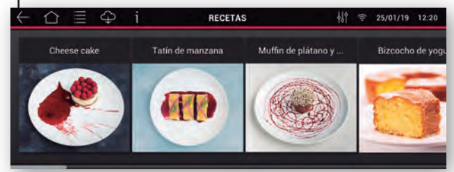
Recetas Acceso al recetario del usuario, recetas mychef y búsqueda de recetas por ingredientes