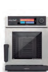
6 GN 1/1