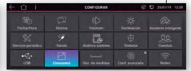
Configurar Acceso a todas las configuraciones del horno