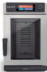
9 GN 1/1