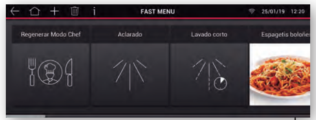
Fast Menu Menú personalizado según cada necesidad