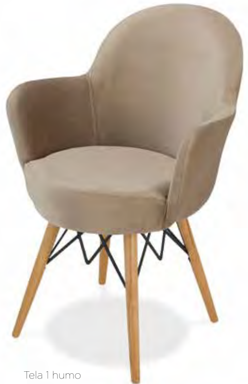
Tela 1 humo