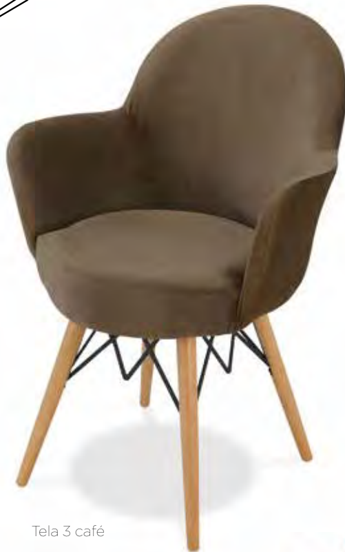
Tela 3 café