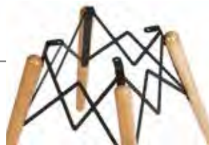
Chapa de hierro cortada a láser y soldada formando una sola estructura.