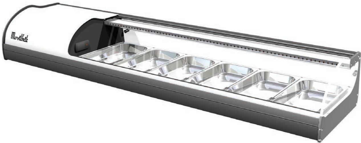
6 BLANCA SUSHI