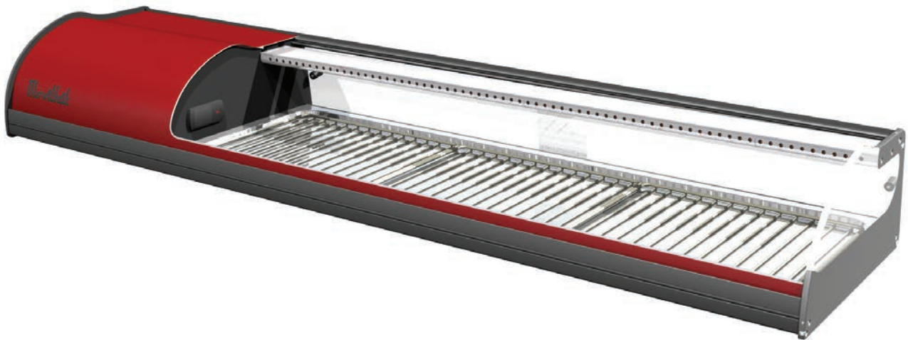
6 ROJA SUSHI PLACA FRÍA