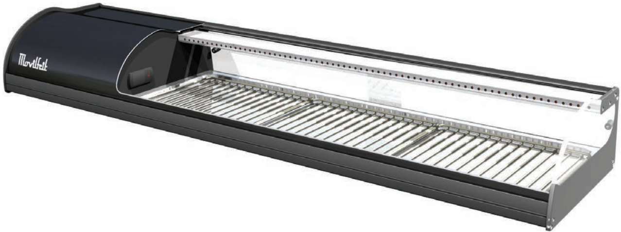
6 NEGRA SUSHI PLACA FRÍA