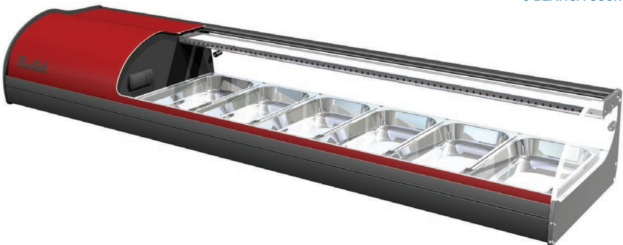
6 ROJA SUSHI