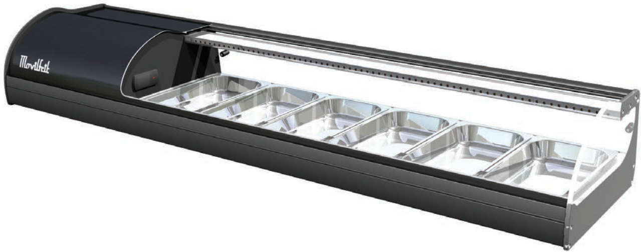
6 NEGRA SUSHI