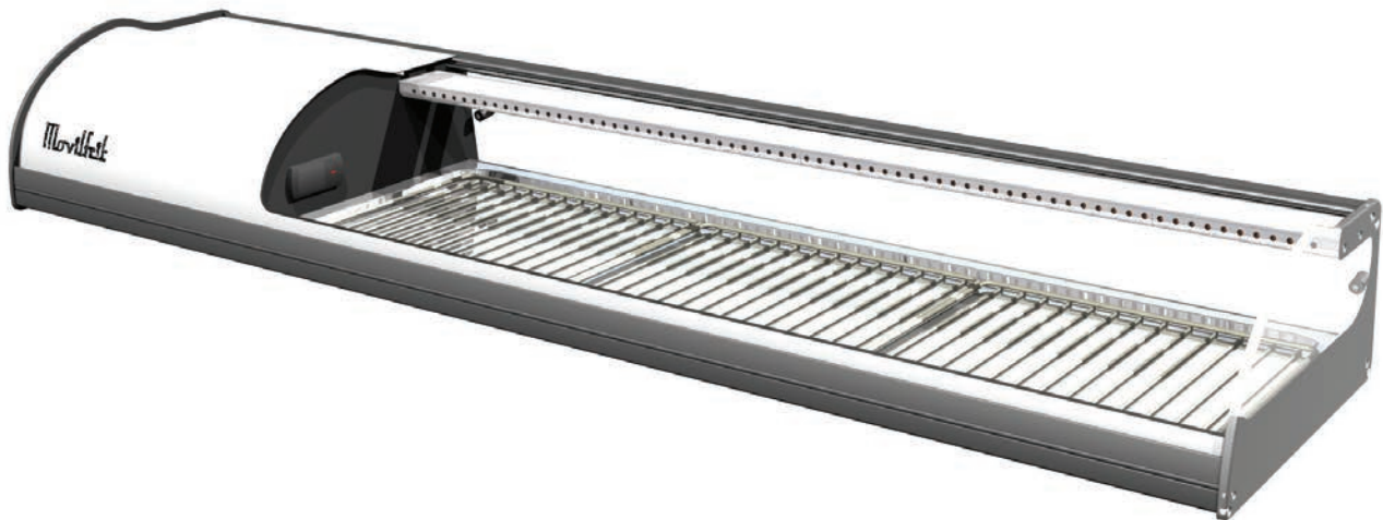
6 BLANCA SUSHI PLACA FRÍA