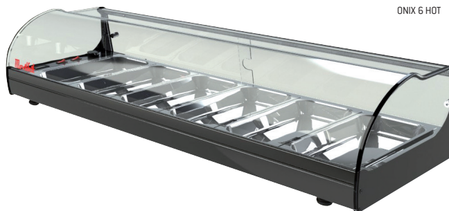
ONIX 6 HOT