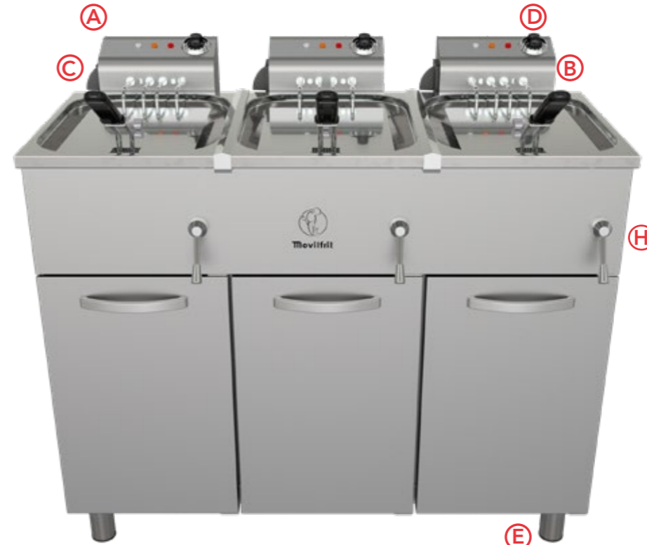
FH 17+17+17 230