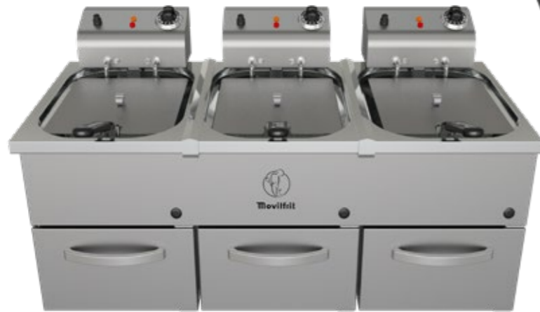
FP 10+10+10 230