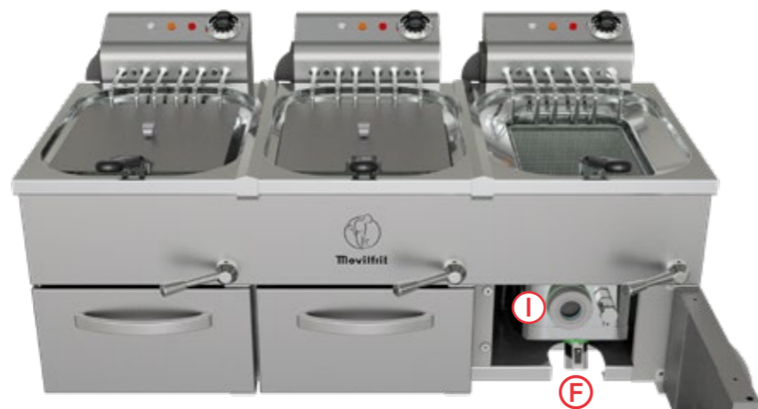
FH 10+10+10 400