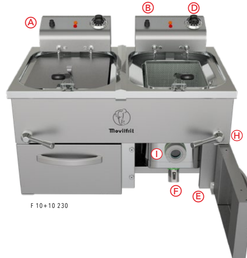
F 10+10 230