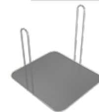
Filtro de residuos Residue filter Filtre à déchets