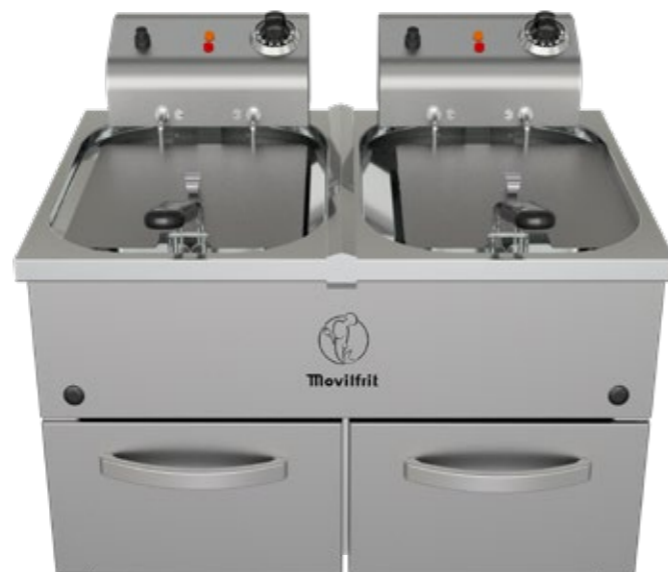
FP 10+10 230