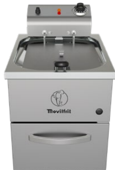
FP 10 230