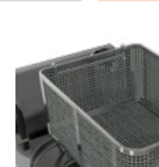
Soporte fijación cesta Basket fixing bracket Support de fixation du panier