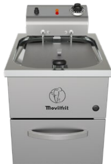
FP 10 230