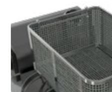
Soporte fijación cesta Basket fixing bracket Support de fixation du panier