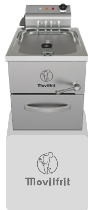
FH 10 230