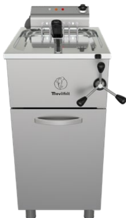
FH 25 400