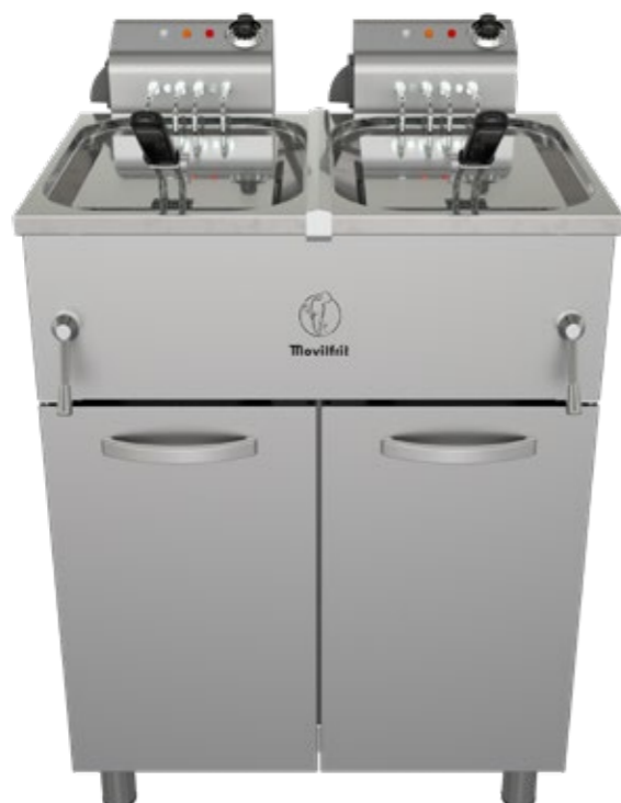
FH 17+17 230