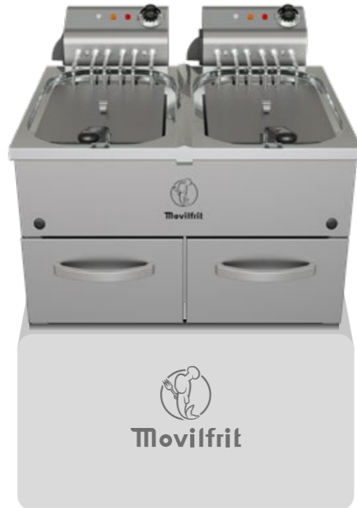
FARP 10+10 400