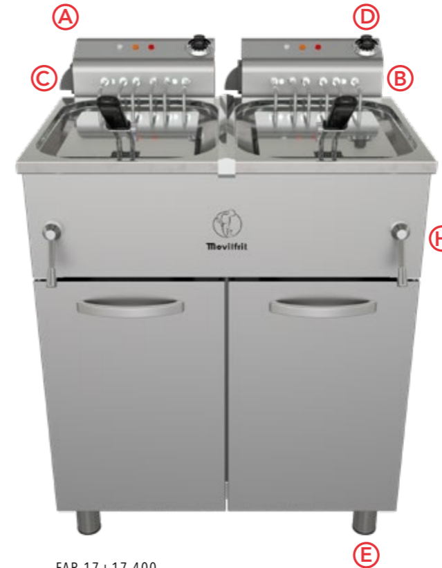
FAR 17+17 400