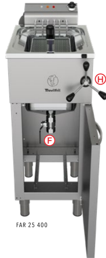
FAR 25 400