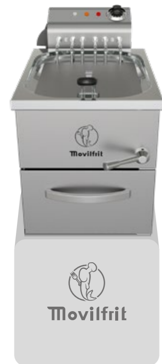
FAR 10 400