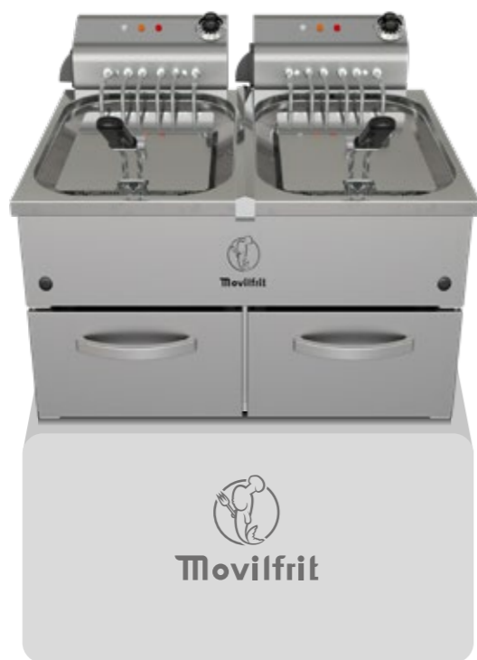
FAP 12+12 400