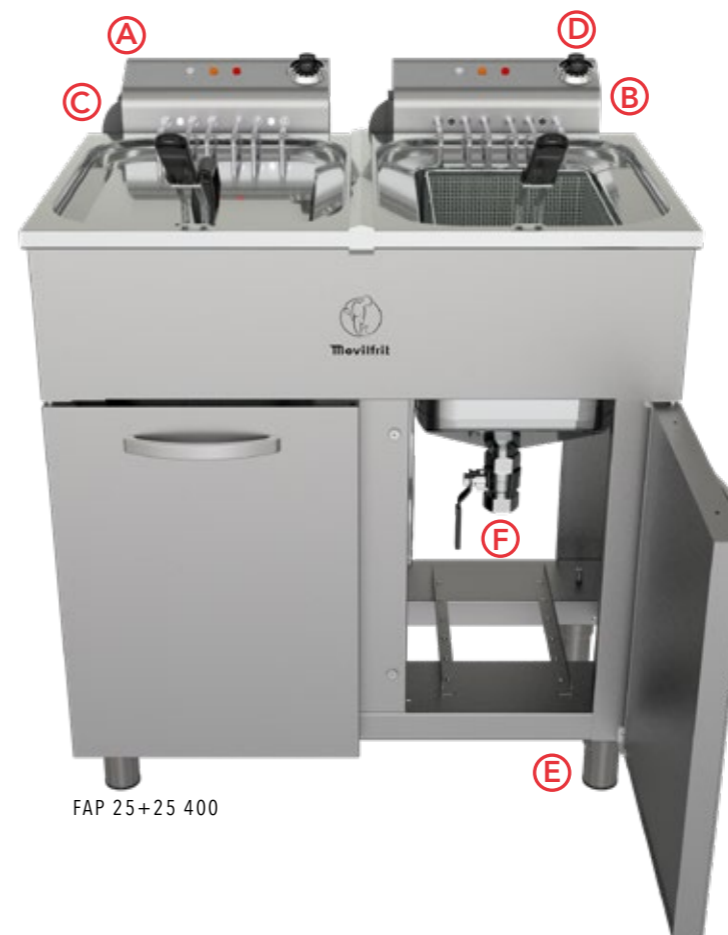
FAP 25+25 400