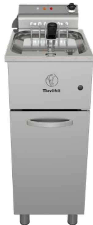
FAP 17 400