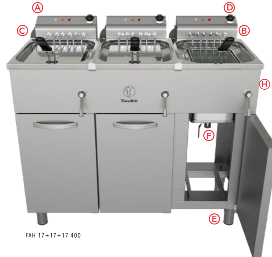
FAH 17+17+17 400