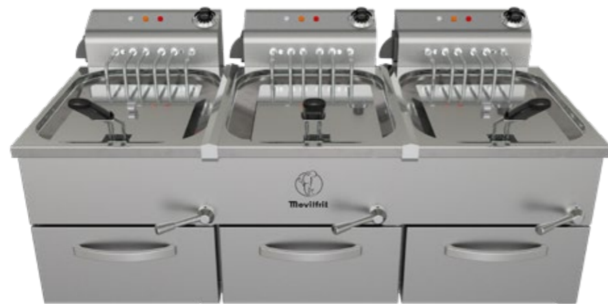
FAH 12+12+12 400