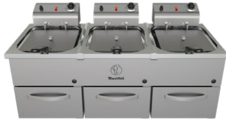
FAP 10+10+10 230