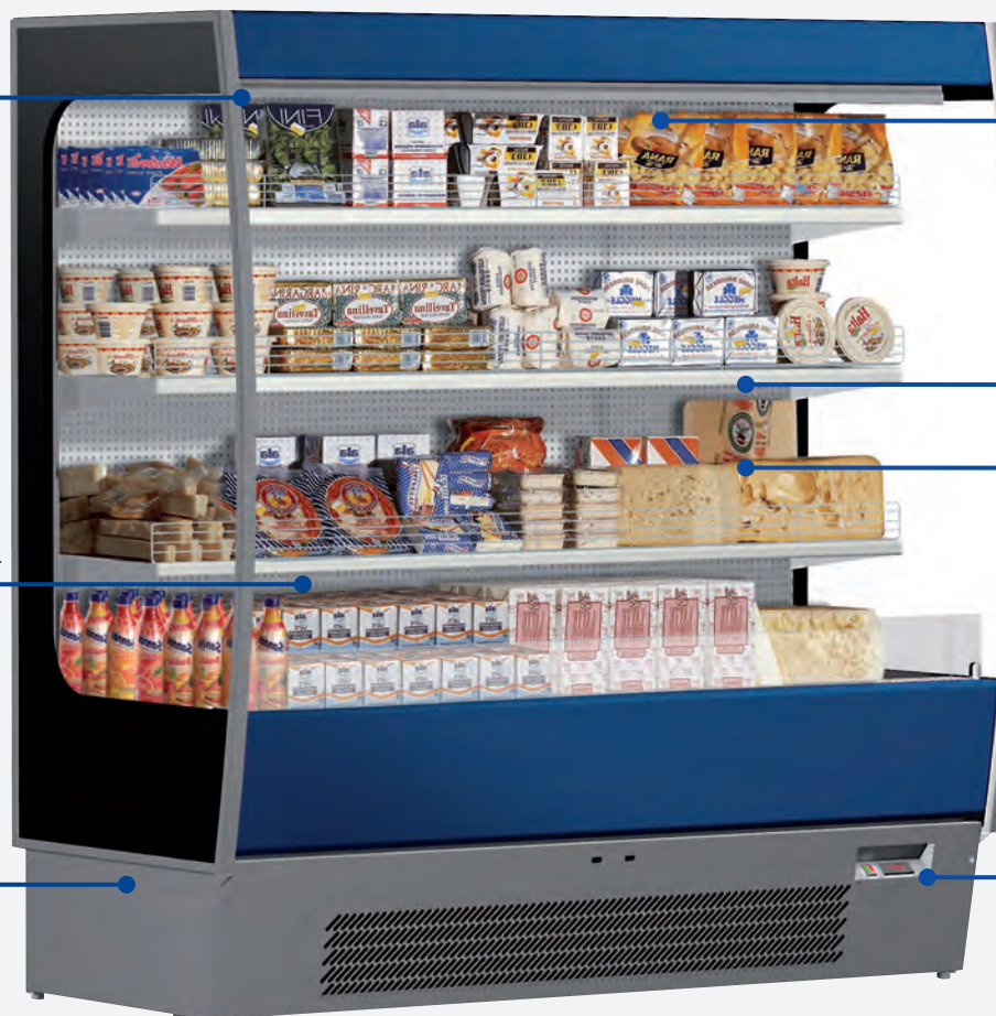
Mod. LIDO SL 187