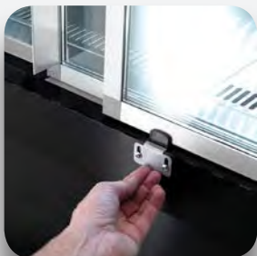
Puertas correderas con doble cristal.