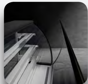
Cristal frontal abatible.