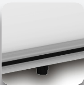
Pies regulables en altura.