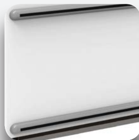
Doble barra protectora.