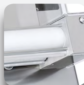
Protector plexiglás y rodillo único.