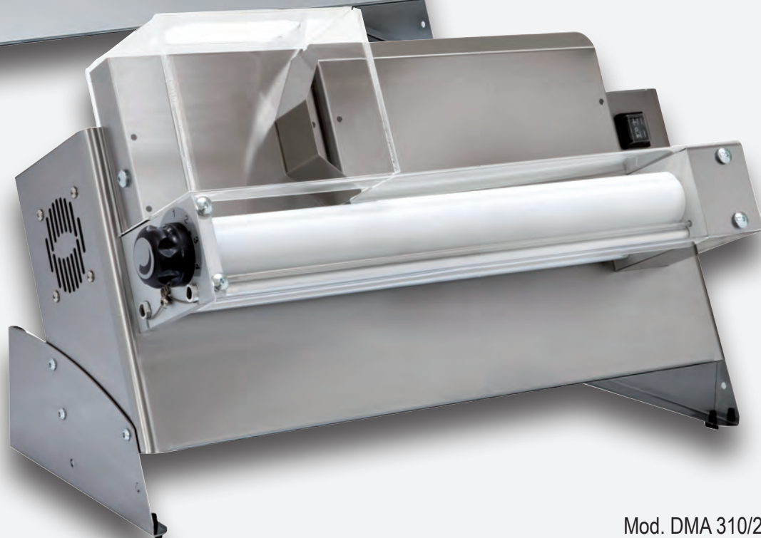
Mod. DMA 310/2