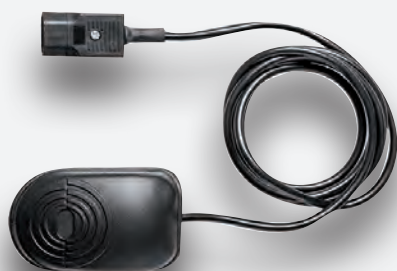
Control a pedal de serie.