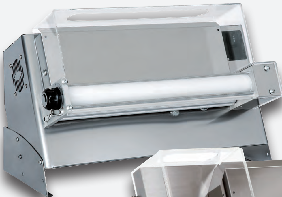
Mod. DMA 310/1