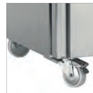
Ruedas en dotación con freno.