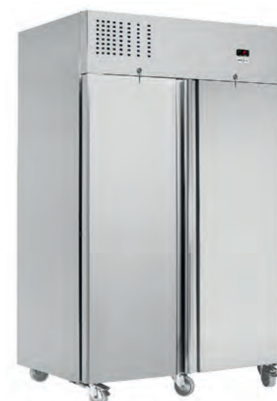
M1 1440 GN TN