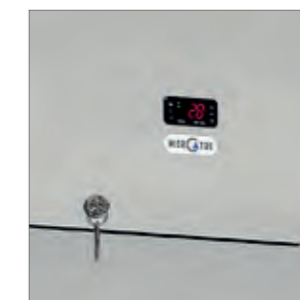
Controlador electrónico con display digital y membrana táctil.