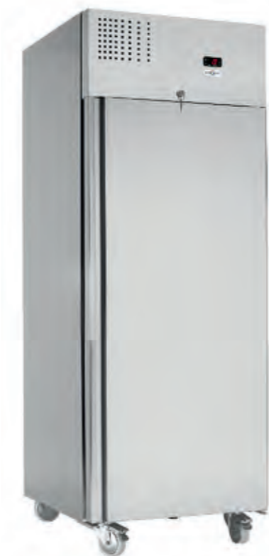
M1 720 GN TN