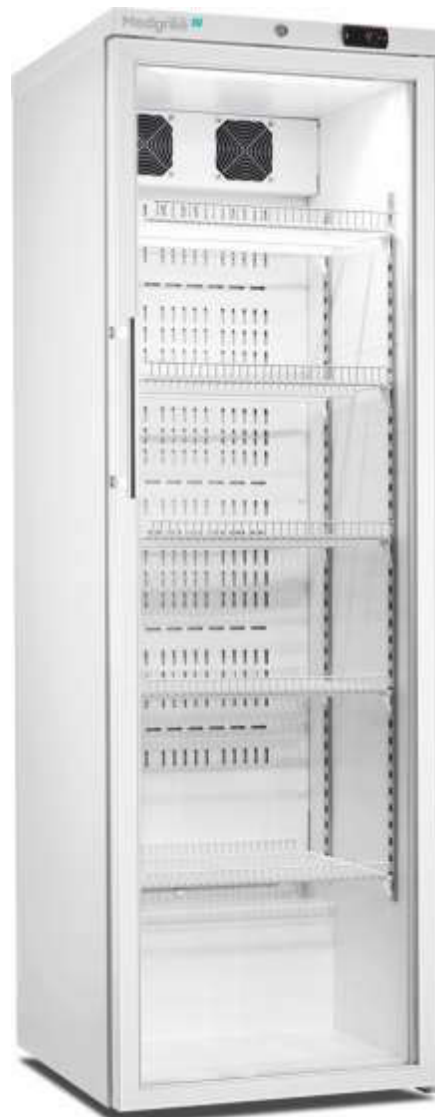
MLRE 450 G