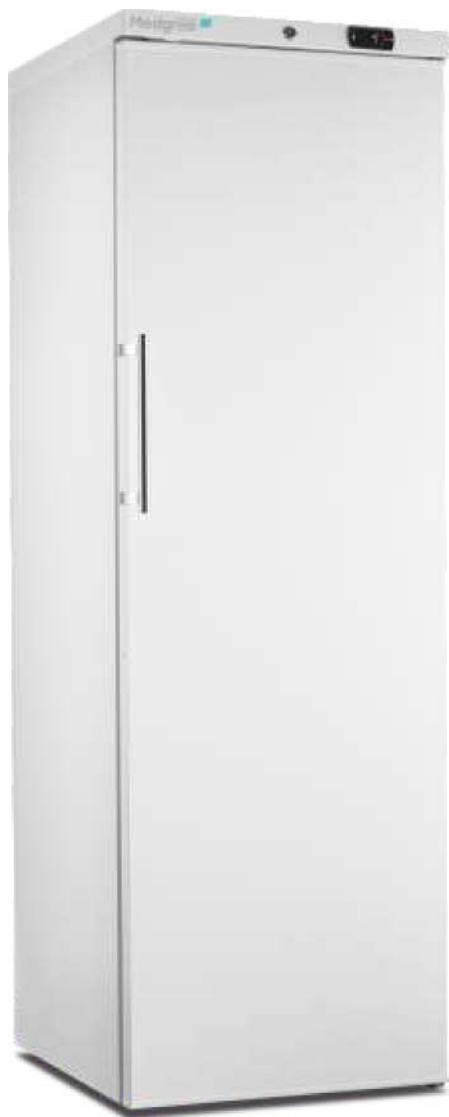
MLRE 450 S