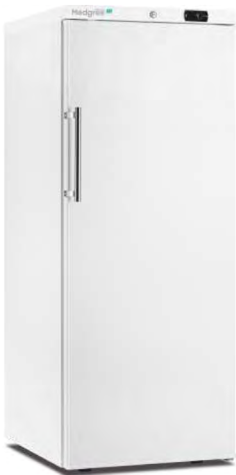
MLRE 350 S