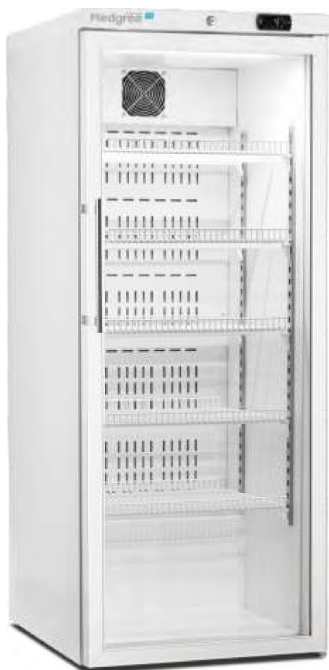
MLRE 350 G