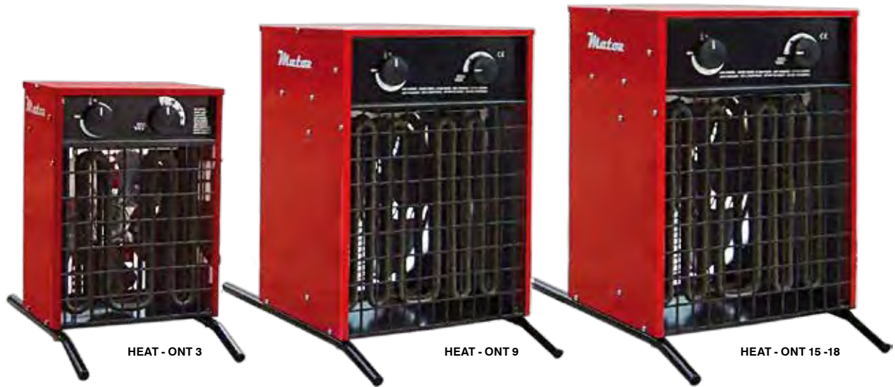
HEAT - ONT 3