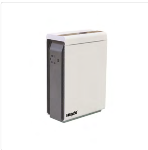
Heylo HL 400 – filtro de aire antivirus

El uso de un filtro HEPA H14 certificado reduce la concentración de virus (como el actual coronavirus) y bacterias.