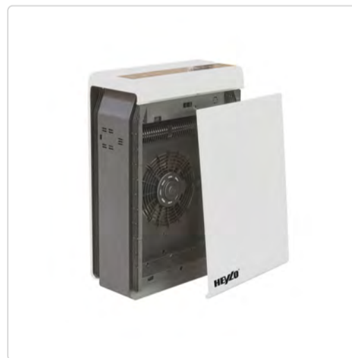
Filtro de aire Heylo HL 400 abierto