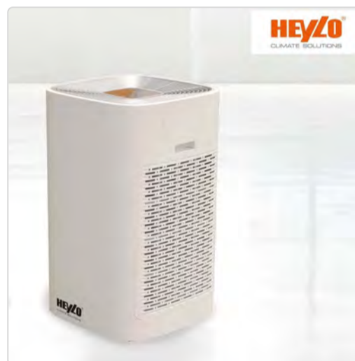
Vídeo del purificador de aire Heylo