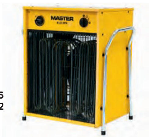
B 5 B 9 B 15 B 22