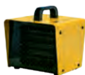
B 2PTC B 3PTC