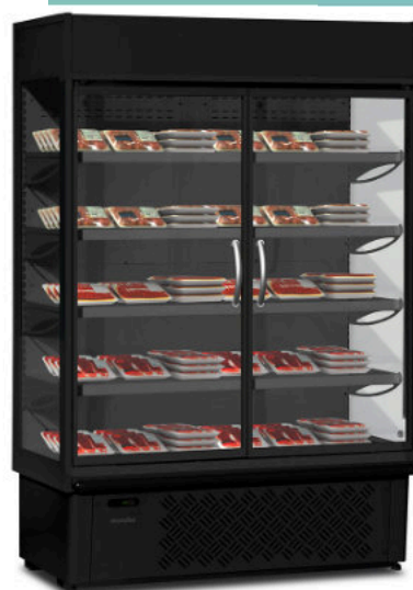
SUPERSUNNY 14 HD B: puertas abatibles y acabado exterior negro