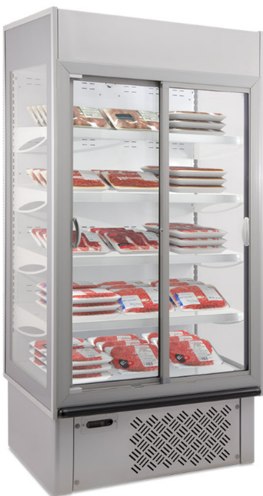
SUPERSUNNY 10 SD G: puertas correderas y acabado exterior silver