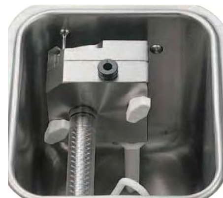
DETALLE SERIE LUCKY: BOMBA DE AIRE