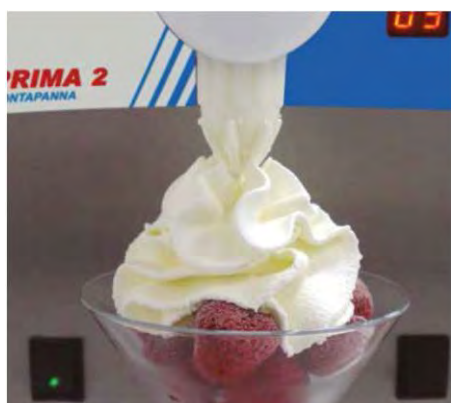
DETALLE PRIMA 2: SERVICIO NATA MONTADA