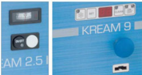
PANEL DE CONTROL KREAM 2,5 VS KREAM 9