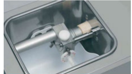
DETALLE BOMBA DE ACERO INOX