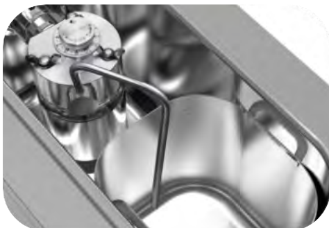
KING: Bomba y depósito extraíble con sistema anti-hielo