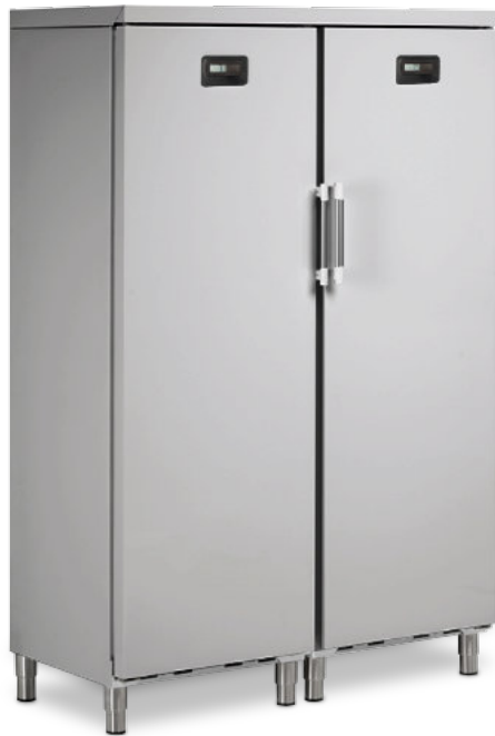
SBS 350 CF

FRÍO - ARMARIOS VERTICALES - PUERTAS CIEGAS - 2 CÁMARAS INDEPENDIENTES