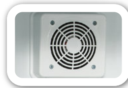
Frío estático con ventilador