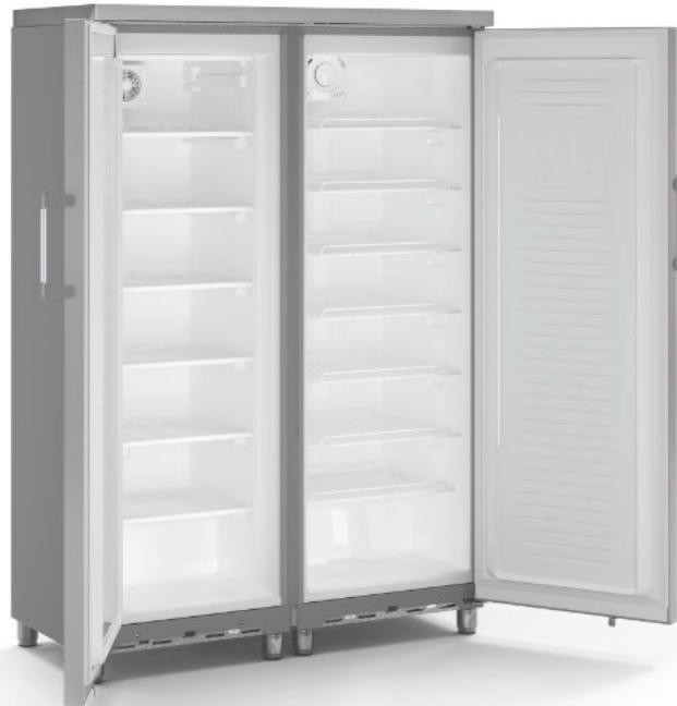
SBS 350 CF. Detalle interior: cámaras independientes de congelación y refrigeración