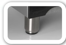
Pies metálicos regulables