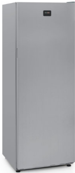
COOL 350 SILVER / FRZ 350 SILVER