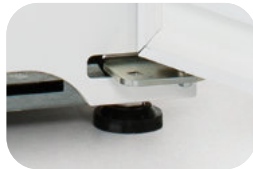
Bisagras apertura 180°