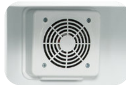
Frío estático con ventilador