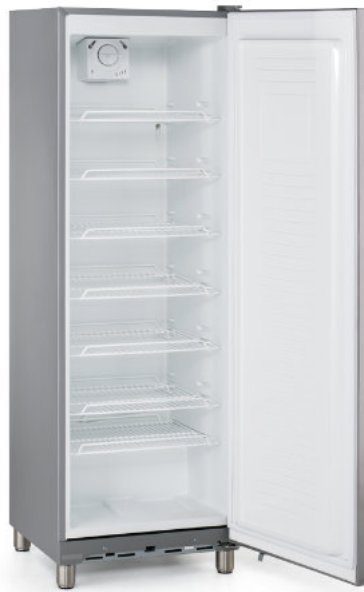
COOL 350 SILVER con pies opcionales y rejillas adicionales