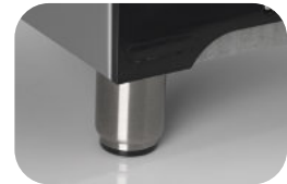
Pies metálicos opcionales