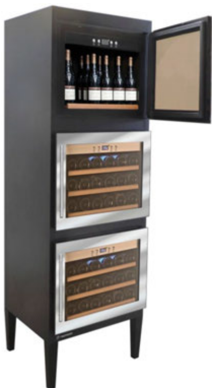
VINITY 3 V