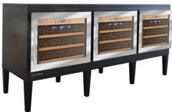
VINITY 3 H