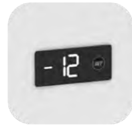
Control digital de temperatura