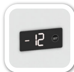
Control digital de temperatura