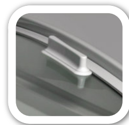
Cristal curvo inclinado