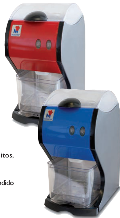
Modelo P.V.P. TR-156 GP ..... 560 €

Características: Medidas: Ancho 410 x Fondo 350 x Alto 495 mm. Potencia: 360 w/230 v. - 50 Hz. Peso: 15 Kg.