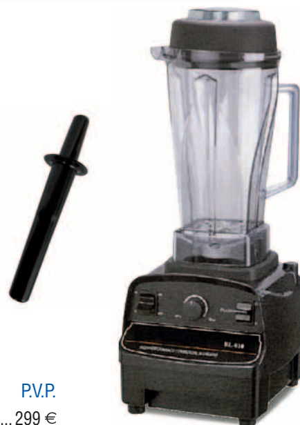
Modelo P.V.P. VIT-MIX ..... 299 €

Batidora profesional de gran potencia que puede funcionar hasta 6 horas en continuo.