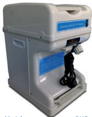
Modelo P.V.P. TR-128 ..... 435 €

Grosor del hielo regulable, especial para cocktails, mojitos, margaritas y caipiriñas. Producción: 3 Kg./min. Microswift de seguridad e interruptor de encendido con protección térmica al agua.