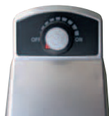
Detalle del variador

Batidora de 2 velocidades Medidas*: 465x170x175 mm Potencia: 400 w, Monf. 220v Rev./min.: 10000/5000 *Alto x Ancho x Fondo Se suministra con vaso de plástico