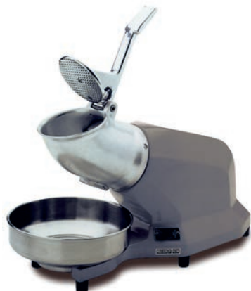
Modelo P.V.P. T-60 Monofásica 230v ..... 275 €

Características: Medidas: Ancho 335 x Fondo 235 x Alto 472 mm. Potencia: 360 w/230 v. - 50 Hz. Peso: 9 Kg.