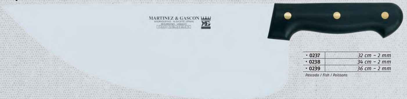
• 0237 32 cm - 2 mm • 0238 34 cm - 2 mm • 0239 36 cm - 2 mm Pescado / Fish / Poissons