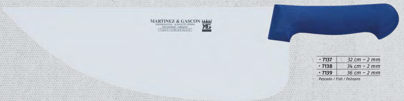
• 7137 32 cm - 2 mm • 7138 34 cm - 2 mm • 7139 36 cm - 2 mm Pescado / Fish / Poissons