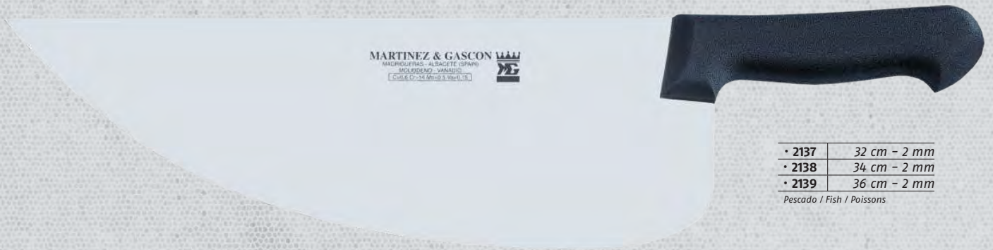
• 2137 32 cm - 2 mm • 2138 34 cm - 2 mm • 2139 36 cm - 2 mm Pescado / Fish / Poissons