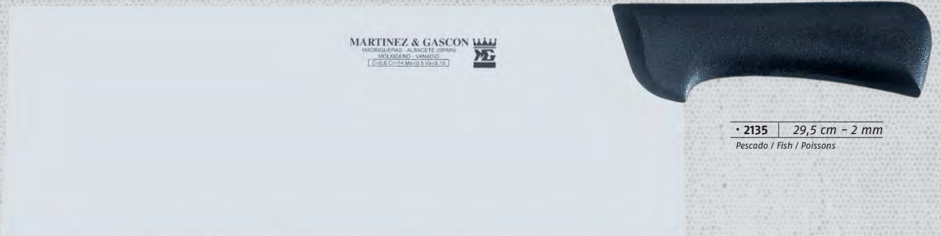
• 2135 29,5 cm - 2 mm Pescado / Fish / Poissons