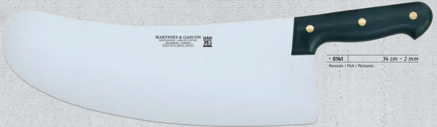
• 0141 34 cm - 2 mm Pescado / Fish / Poissons