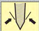
BORDE ANGULAR COMÚN COMMON ANGLE EDGE