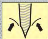
BORDE PULIDO CON HENDIDURA HOLLOW GROUND EDGE