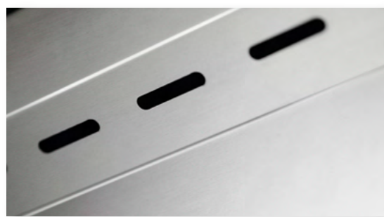
Aportación de aire Air supply