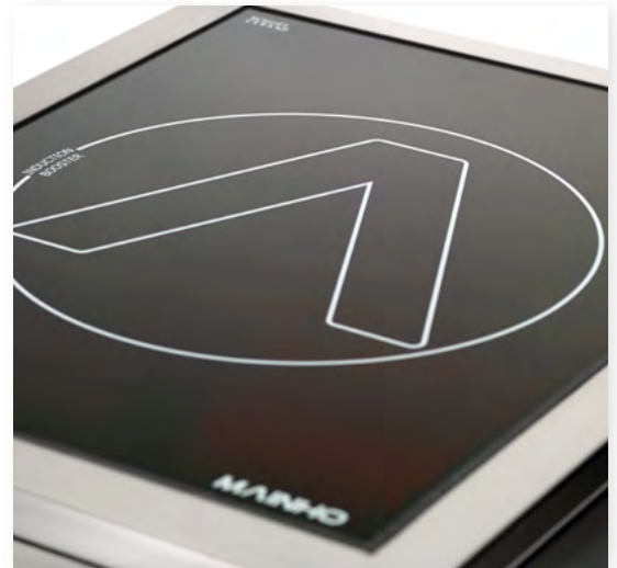
Detalle del cristal Detail of glass