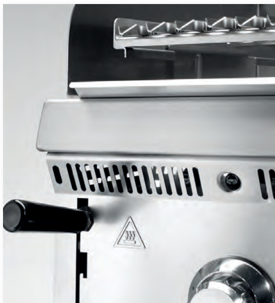
Elevador de rejillas Rack lifter