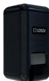
REF: CJ-3003-BL Acabado NEGRO