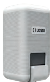
REF: CJ-3003-B Acabado BLANCO